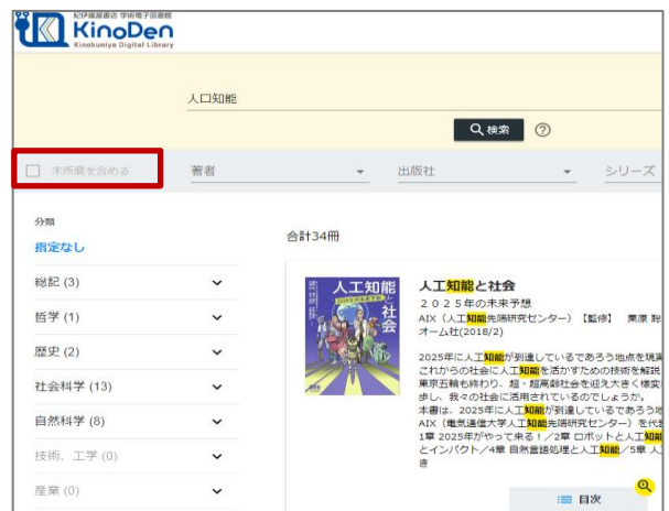
所蔵タイトルのみ

「未所蔵を含める」にチェックを入れると、本学にない電子書籍についても、内容紹介を確認し、試し読みをすることができます。